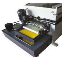
Séparateur magnétique de copeaux optionnel