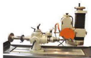
Option Attachement Hélicoïdal