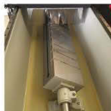
Plateau magnétique optionnel (avec système T-SLOT sur un côté)