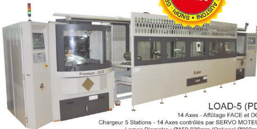
LOAD-5 (PD) 14 Axes - Affûtage FACE et DOS Chargeur 5 Stations - 14 Axes contrôlés par SERVO MOTEUR Lames Diamètre : Ø150-600mm (Optional Ø800mm)