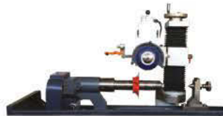
Option Diviseur Motorisé