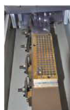
Plateau magnétique pour plaquettes HW optionnel