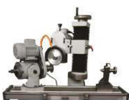
Option Attachement Couteaux Circulaires