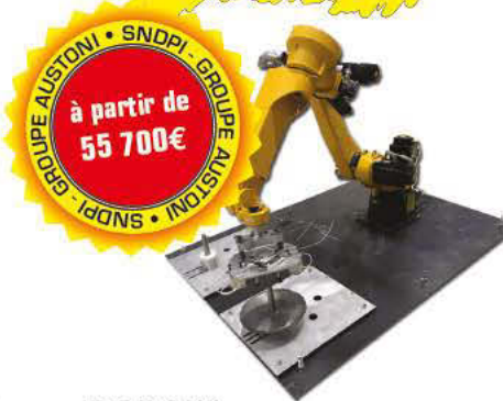
ROBO-X 6 Axes - robot de chargement Automatique