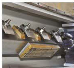
Fixation mécanique avec T-SLOT